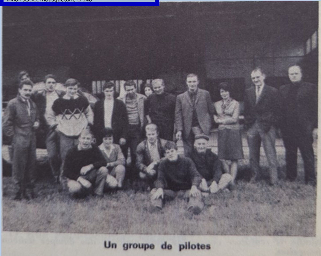
Un groupe de pilotes