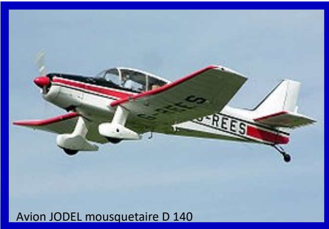
Avion JODEL mousquetaire D 140

L'aviation de l'entre deux guerres a suscité un vif engouement, encouragé par Le Front Populaire de 1936 qui favorisait l'accès au pilotage pour le plus grand nombre, en créant les Sections d'Aviation Populaire (SAP). Créé à cette époque, l'ACCM (l'Aéroclub Central des Métallurgistes) accueille les "métallos" de SNECMA Gennevilliers, Corbeil, Villaroche à partir de 1955. Pilotes et élèves pilotes sont alors subventionnés par le CCE SNECMA. C'est à partir de 1980 qu'intervient la décentralisation des Aéroclubs qui passent sous la tutelle des CE locaux.