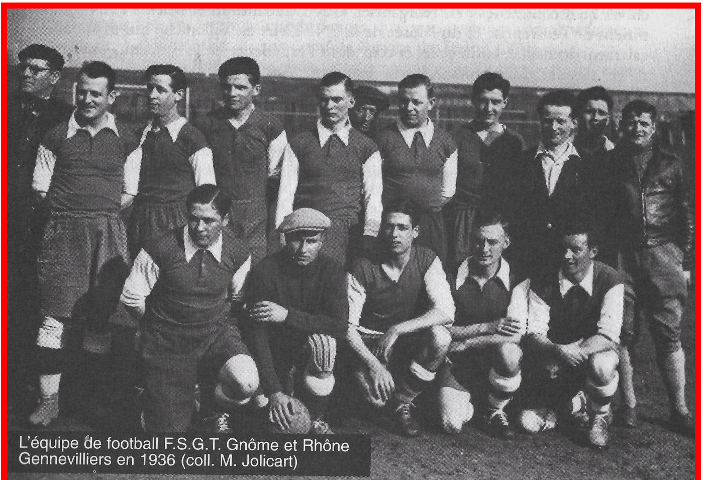
L'équipe de football F.S.G.T. Gnome et Rhône Gennevilliers en 1936

Un club sportif existait chez Gnome et Rhône, il était financé par la société et était dans les mains du patronat.