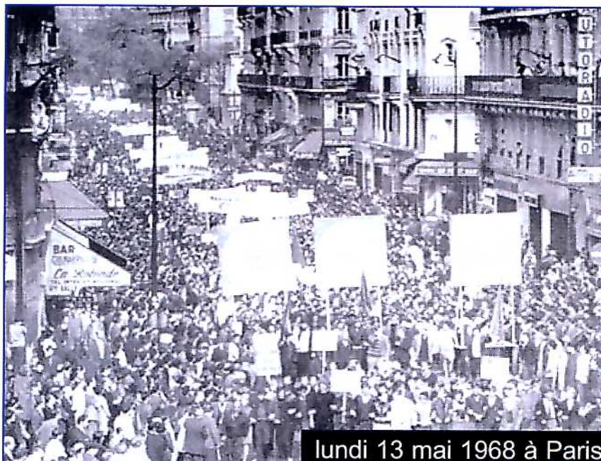
lundi 13 mai 1968 à Paris

Le 25 mai à quinze heures, au ministère des affaires sociales, rue de Grenelle , où s'ouvrait une conférence tripartite : gouvernement, patronat, syndicats.