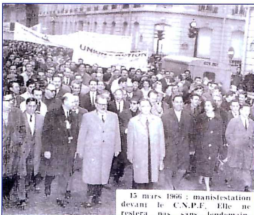
15 mars 1966 : manifestation devant le C.N.P.F. Elle ne restera pas sans lendemain

Après cette démonstration quelques milliers d'étudiants décident d'occuper le quartier latin investi par la police. De violents heurts opposent les manifestants aux brigades spéciales de police.