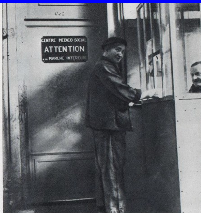
2 Depuis l'usine, on peut accéder directement au centre médical, par une porte intérieure.

M IEUX qu'un long texte, ces quelques photos vous montreront quelques-uns des principaux aspects du centre médical de Kellermann et les possibilités qu'il offre aux malades de la SNECMA. Au passage, signalons que ce centre reçoit également les malades assurés sociaux n'appartenant pas à la Société. Ces malades, au même titre que le personnel de la SNECMA, n'ont à payer que le montant du « ticket modérateur » qui leur est d'ailleurs remboursé s'ils sont affiliés à une Mutuelle.