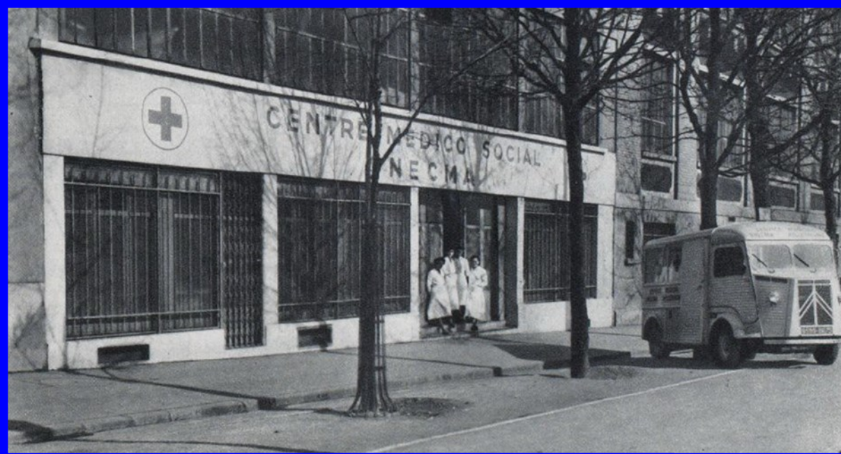
DISPENSARE DE KELLERMANN

Le service prévention a conçu et fait installer 8 postes expérimentaux à l'ajustage et polissage des aubes, pour l'aspiration des poussières.