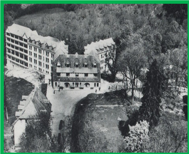
SANATORIUM DE LA GRANGE SUR LE MONT

Un sanatorium dans le Jura à 700 m d'altitude sur la commune de La Grange sur le Mont est acheté avec des fonds du patronat de l'Aéronautique et des Comités d'Entreprise dont le CCE SNEMA. Il possède 191 lits.