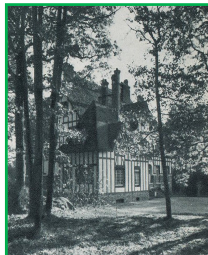
MAISON DE REPOS DES ROCHES A CHAILLY EN BIÈRE.